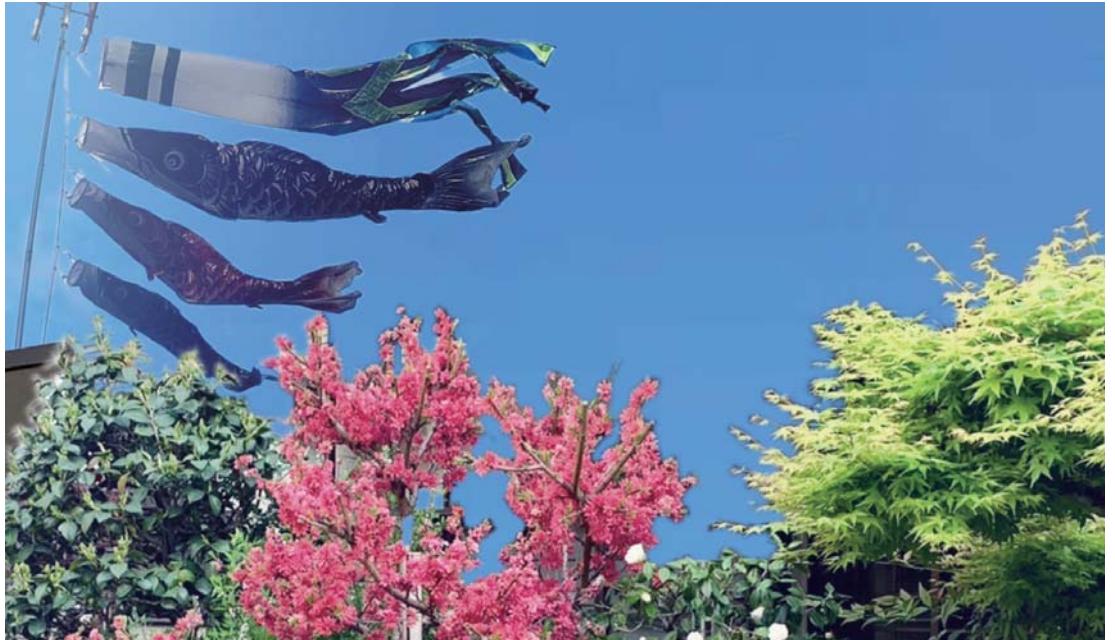
新調された鯉のぼりと境内に咲く花桃(4月4日)

号数 第 3 3 5 号 発行日 令和 5 年 5 月 14 日 発行所 金光教 韮 教会 〒 550-0011 大阪市西区阿波座 2-2-10 TEL&FAX 06(6541) 6313 mail: utubo1905@gmail.com