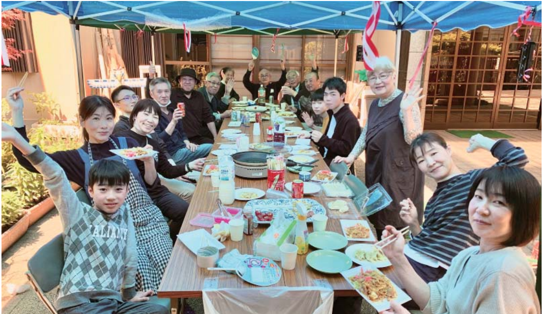
勧学祭の後、境内にてガーデンパーティーが開催されました（4月14日）

号数 第 3 4 2 号 発行日 令和 6 年 5 月 12 日 発行所 金光教 韮 教会 〒 550-0011 大阪市西区阿波座 2-2-10 TEL&FAX 06(6541) 6313 mail: utubo1905@gmail.com