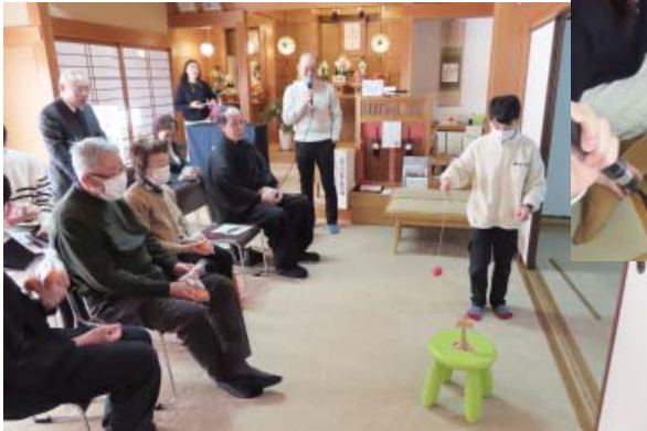
逆けん玉ゲーム 玉をけんだまの棒に入れるゲーム↓

初月例祭後、信徒会総会が行われ、信徒会長のあいさつの後、令和6年の決算報告がありました。総会閉会后、お広前において、新年会が開催され、青年信奉者による、ゲーム大会が行われました。