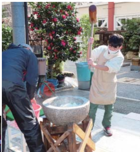
みんなで力いっぱいお餅をつきました