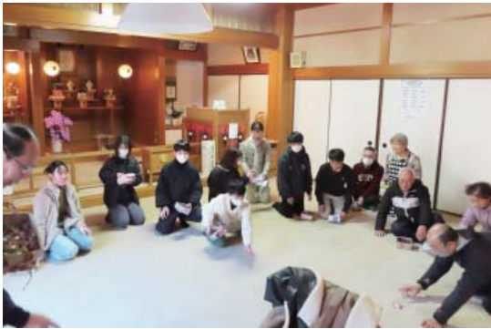
広前にて節分豆まき (豆も飴やチョコも) ←

2月2日、雨も上がり、太陽の光がのぞく中、広前では節分の豆まき、境内ではもちつき大会が行われました。