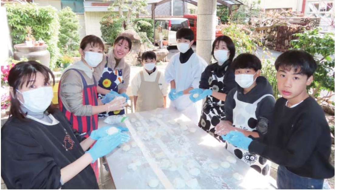
恒例豆まき & もちつき大会が開催されました (2月2日)

号数 第 3 4 8 号 発行日 令和 7 年 3 月 9 日 発行所 金光教 韮 教会 〒 550-0011 大阪市西区阿波座 2-2-10 TEL&FAX 06(6541) 6313 mail: utubo1905@gmail.com